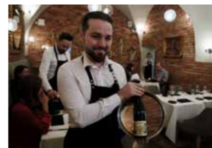
Vasemmalla: Taidetta. Art Restauracja näyttää huippuviinit moderniin puolalaiseen ruokaan.