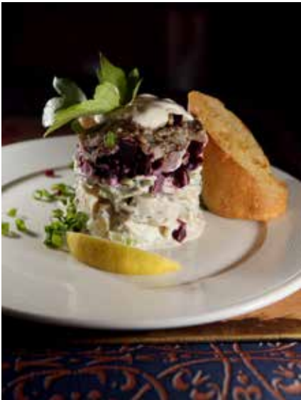
Iskevää. Ravintola Starkan sillitartar on tyrmäävän maukas.

ruuille, Puolasta on nimittäin hiljalleen tulossa kiinnostava viinimaa.