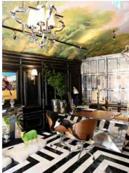
Uutuus. Keväällä avattu designhotelli Balthazar vilisee mehukkaita yksityiskohtia.

ILTAPÄIVÄ. Krakovan juutalaiskaupunginosa Kazimierz jatkaa luontevasti päivää. Nauti taiteilija Heinrich Zillen hiilipiirroksilla ladatun tunnelmallisen Starkan (Józefa 14) maukkaista puolalaisher-