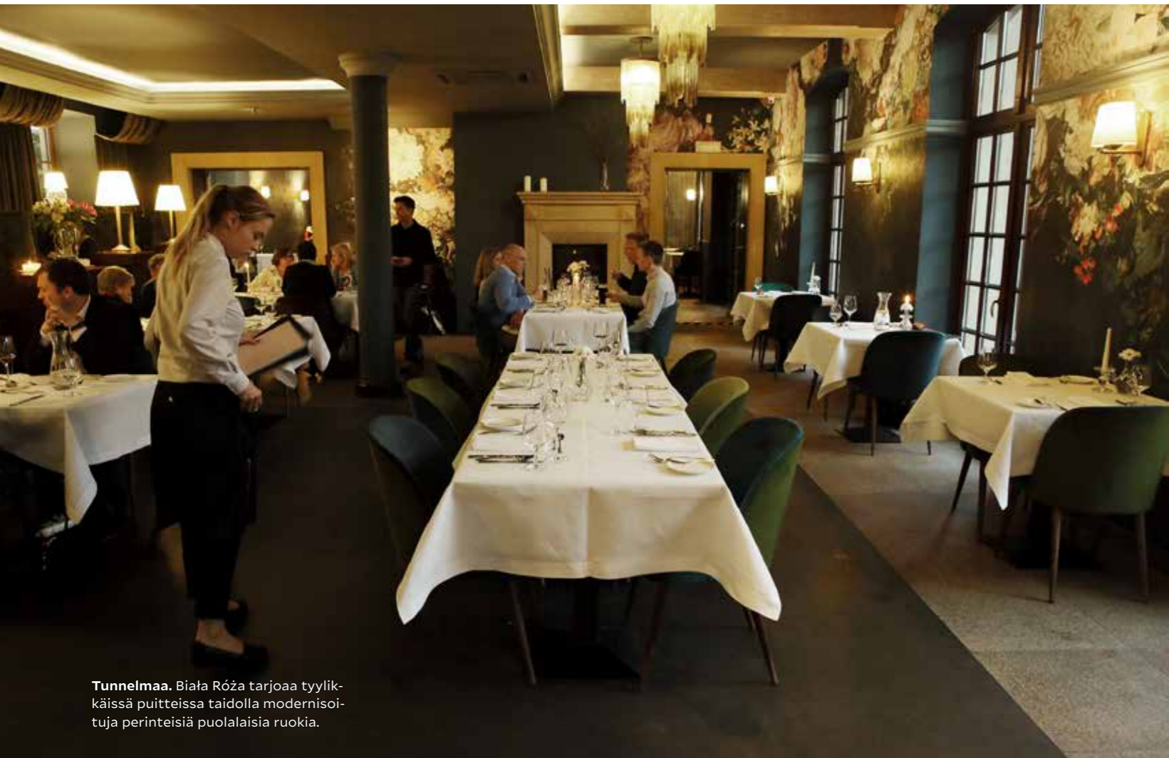
Tunnelmaa. Biała Róża tarjoaa tyylikäissä puitteissa taidolla modernisoituja perinteisiä puolalaisia ruokia.